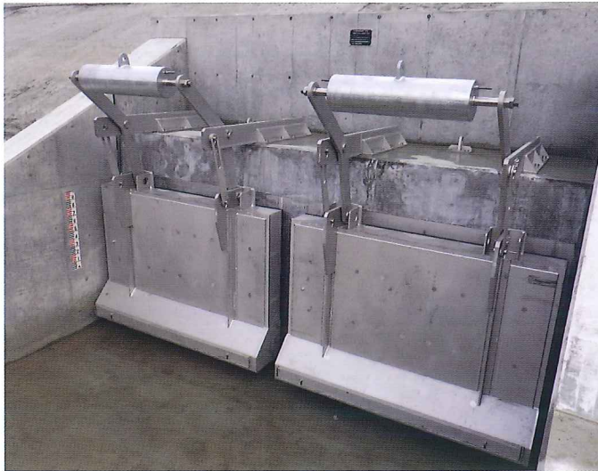
▲岩手県沿岸広域振興局 小友地区 有効幅2.3m×有効高1.6m 2門

フラップゲートは、水位(水圧)により無動力で開閉する逆流防止用ゲートとして使用されています。しかし、扉体重量に比例して内水位が高くなるため大型ゲートには不向きでした。